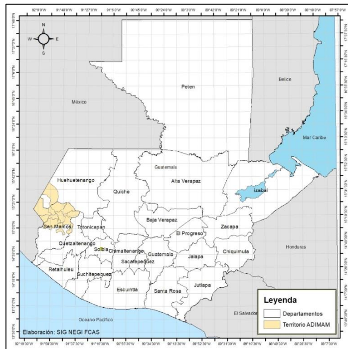
Ilustración 1 - Ubicación del territorio de ADIMAM

Dichos municipios forman parte de los departamentos con mayores índices de pobreza del país con respecto al promedio nacional: 68.54% frente al 53.71%, respectivamente concentrándose –esencialmente- en las zonas rurales donde el 76.43% de la población vive en situación de pobreza, con pocos y precarios servicios básicos –especialmente agua potable y saneamiento ambiental- en una región de alta vulnerabilidad ecológica.